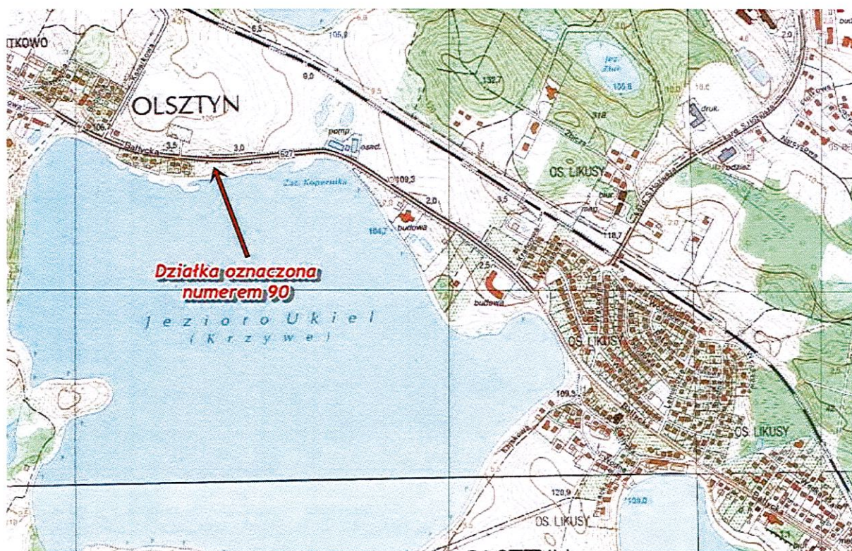
Mapa Nurkowiska Miejskiego nr 1